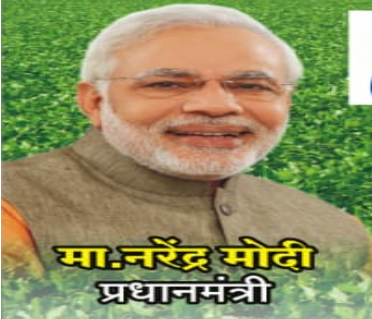
मा.नरेंद्र मोदी प्रधानमंत्री