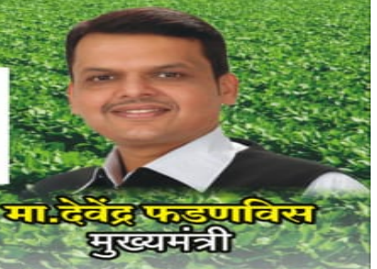
मा.देवेंद्र फडणविस मुख्यमंत्री