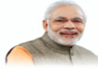
श्री. नरेंद्र मोदी मा. प्रधानमंत्री