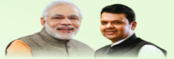
श्री. नरेंद्र मोदी मा. प्रधानमंत्री