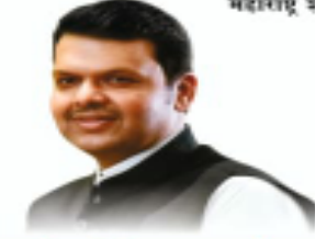
श्री. देवेंद्र फडणवीस मा. मुख्यमंत्री

अल्प व अत्यल्प भूधारक शेतकऱ्यांना दरमहा मिळणार निवृत्तीवेतन